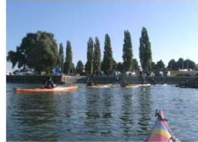
Veluwe Rally 24 september 2017 op de IJssel van Deventer naar Kampen