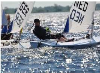
ONK Laser Masters 25 t/m 29 mei 2017 op de Beulakerwilde

Is Overijssel wel een echte watersportprovincie? Volgens ons is het antwoord ja. We kunnen allemaal trots zijn op de steentjes die Overijssel aan de watersport in de brede zin bijdraagt. Zo maar een paar voorbeelden: