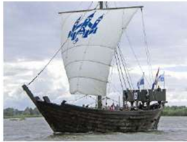
Internationale Hanzedagen 15 t/m 18 juni 2017 op de IJssel bij Kampen